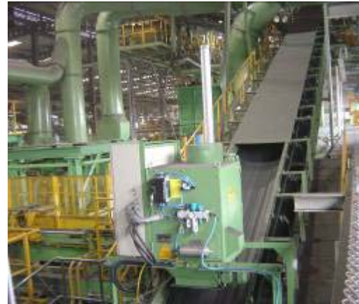
AT1 型砂在线检测装置

准备所有必须的资料，与客户一起确定的性能数据，形成一个特定项目设备方案的基础。由于接口的数量被保持在最少的水平，以及我们全球公认的质量标准，项目运行将非常有效。