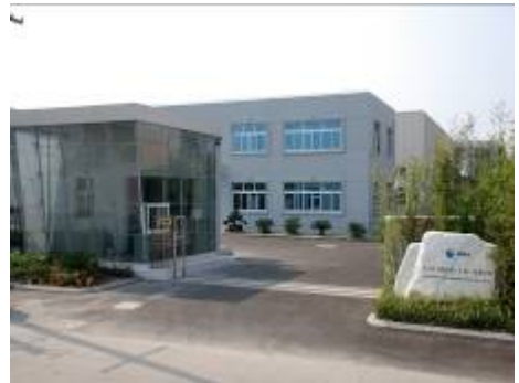
爱立许集团中国公司

另外爱立许中国公司拥有一支经验丰富的中外籍售后服务队伍,可以及时帮助用户进行设备的维护指导,检查及维修。