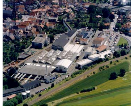
爱立许集团公司总部

爱立许集团将一如既往地，以其创新的专利技术、优良的品质、周到的服务，保障设备安全、可靠、高效运行，使客户制备出高品质的产品。