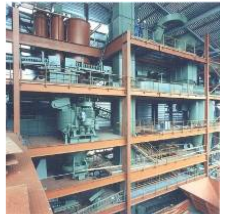
塔式布置型砂生产车间