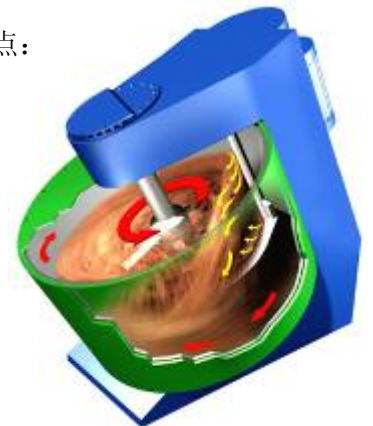
爱立许混砂机模型