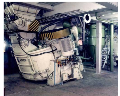
爱立许真空混砂机