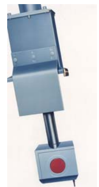
FKP 水分温度检测装置