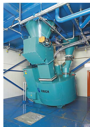
Figure 2: 爱立许强力混合机