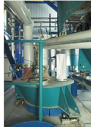
Figure 3: 位于混合机上部的配料系统

爱立许设备有荷重传感器和信号放大器的电子秤。在配料装置,称斗,秤门的设计上的丰富经验使我们的设备能满足客户从粉料,块料,粘性物料直到液体和糊状料的各种特殊的需要。