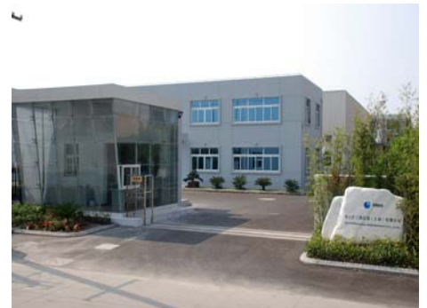
Figure 4: 爱立许集团中国公司

另外爱立许中国公司拥有一支经验丰富的中外籍售后服务队伍,可以及时帮助用户进行设备的维护指导,检查及维修。